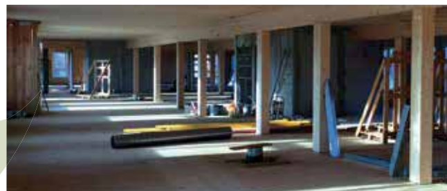
140 logements collectifs R+4 à Ris Orangis - Wilmotte & Associés - Promicéa.

Exemple de réalisation labellisée « Bâtiment Bas Carbone » :