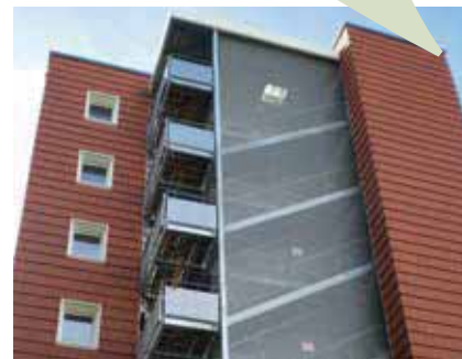
Logements collectifs R+7 à Saint-Dié-des-Vosges - ASP Architecture - Le Toit Vosgien.